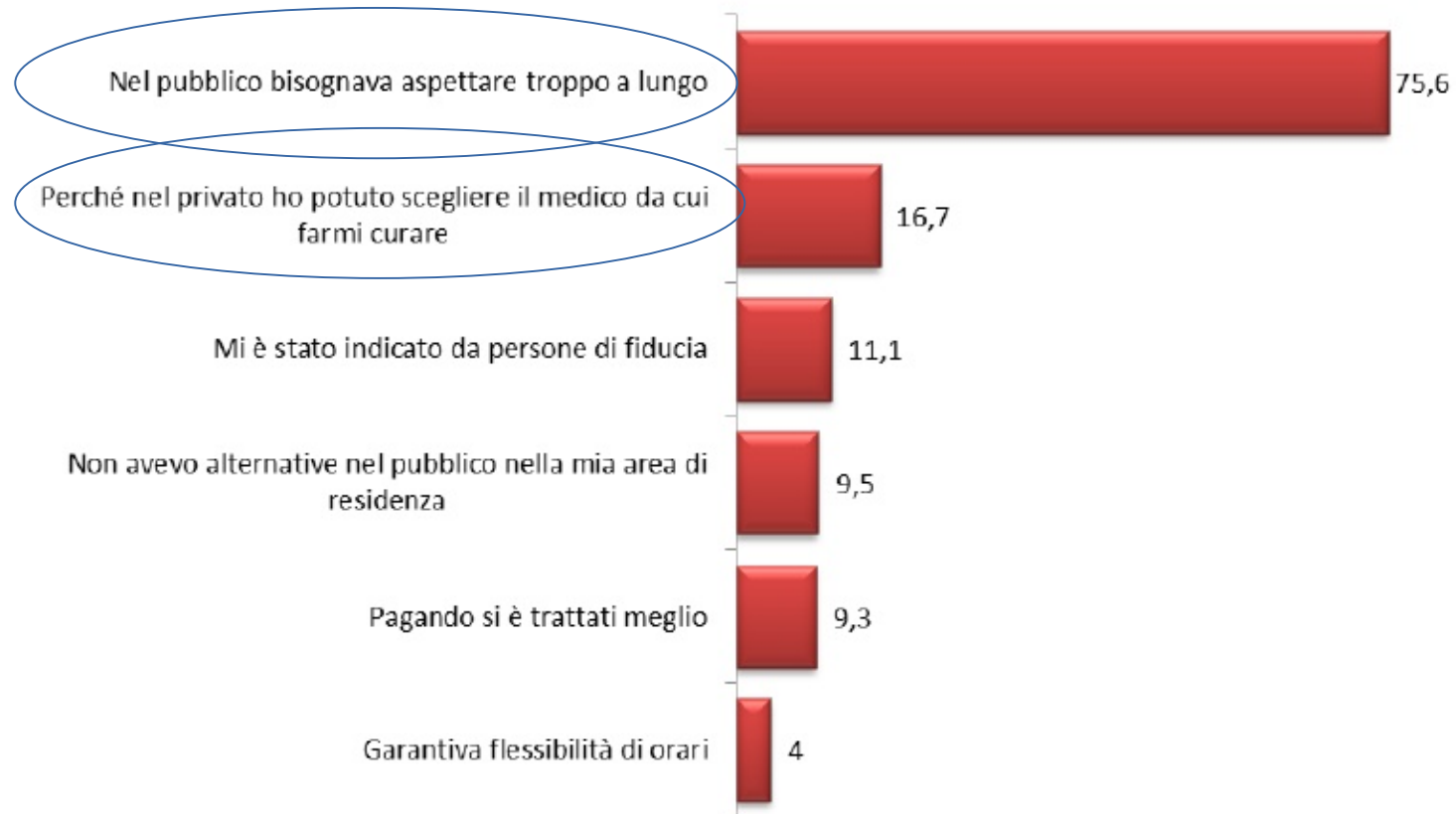
Fig. 20 - Principali motivazioni del ricorso a cure specialistiche ed esami diagnostici a pagamento (risposte in %)