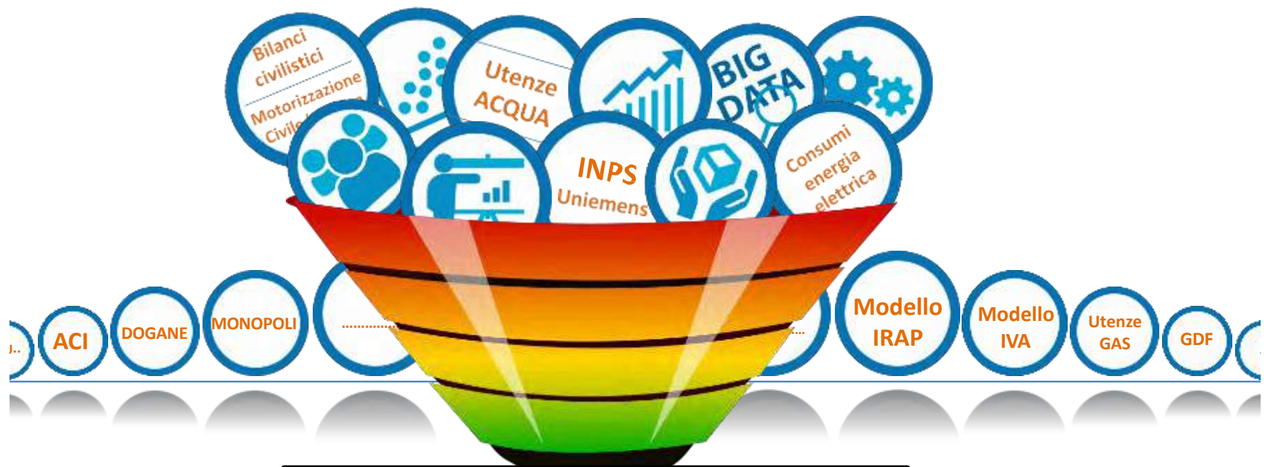
INDICE SINTETICO DI AFFIDABILITÀ

Nell'era dei Big Data la stima del grado di affidabilità fiscale si può agevolmente basare anche sulla comparazione dei dati dichiarati ai fini degli ISA con le informazioni richieste in altri modelli di dichiarazione e con il confronto con altre banche dati esterne .