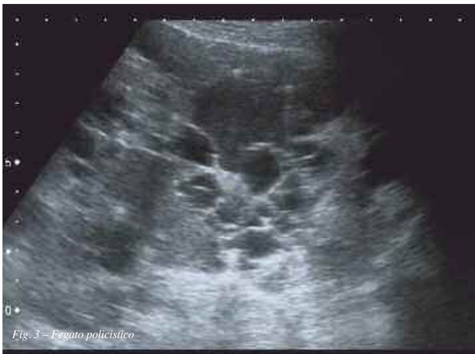
Fig. 3 – Fegato policistico

La paziente viene inviata al chirurgo, isterectomizzata due settimane dopo la diagnosi e successivamente inviata al nefrologo per l’impostazione del follow up clinico e di imaging, sia ecografico, eseguibile presso il mmg, che TC e RM..