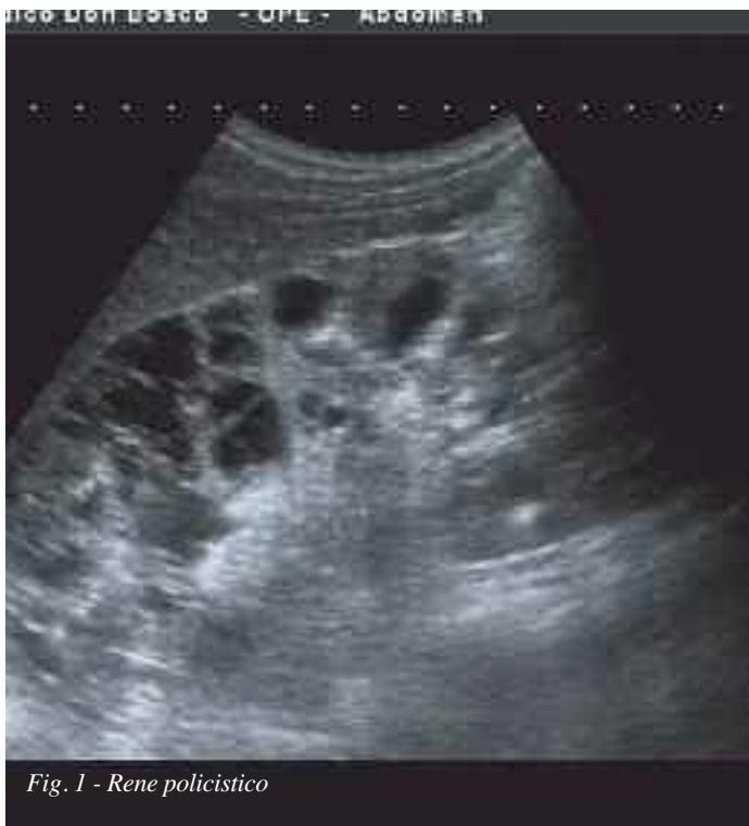
Fig. 1 - Rene policistico

Non si osservano altre alterazioni a carico degli organi parenchimali addominali e pertanto viene posta la diagnosi ecografica di "Fibromatosi uterina ed idronefrosi di I grado bilatera-